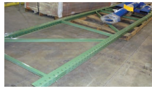
Dimensions réelles de l'expédition : 104L x 42l x 43H. La densité est calculé à 104L x 48l x 48H selon les règles de longueur excessive (voyez les règles).