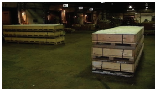
2 palettes = 104L x 46l x 50H: référez-vous aux règles de longueur excessive du guide de référence du cubage afin de déterminer le cubage exact.