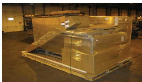
100L x 68l x 52H, cubé à: 100L x 96l x 96H.